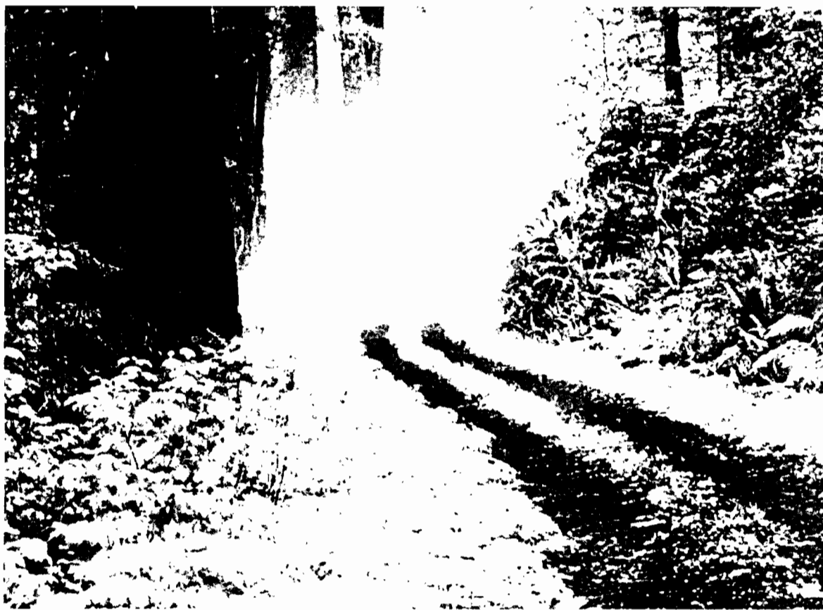
Os bosques están ameazados polo paso de carreteras, extracción de madeira e os encoros, entre outros.

A EMPRESA LUCENSE DE TABOADA CASA MACÁN ELABORA O ÚNICO QUEIXO BAIXO EN LACTOSA DE GALICIA QUE CHEGA A TODO O MERCADO NACIONAL GRACIAS AS CADEAS DE DISTRIBUCIÓN. NO SEU AFÁN DE MELLORA E INNOVACIÓN TEN PREVISTO COMERCIALIZAR UNHA FONDUE DE QUEIXO FEITO A PARTIRES DE VARIETADES GALEGAS.