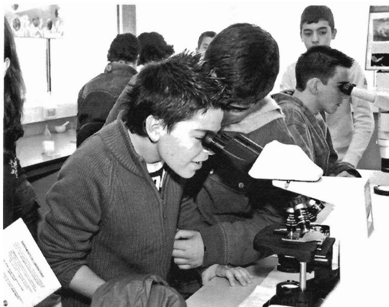
Jornada de puertas abiertas sobre investigación biológica en la Universidade de Vigo.

La contaminación por mercurio se incrementó enormemente en las últimas décadas debido al aumento de la industria y a la alta volatilidad del compuesto.