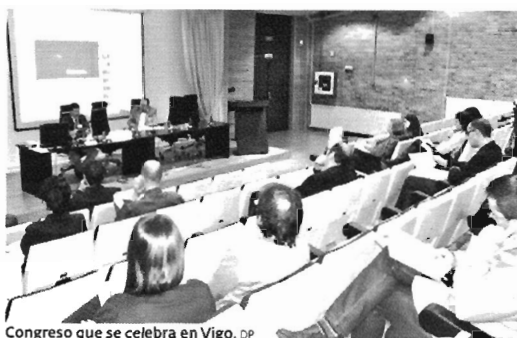
Congreso que se celebra en Vigo. DP

El 'I Congreso Internacional sobre Discurso non Lírico na Poesía Contemporánea' cita en la Universidade de Vigo, en la Facultade de Filoloxía e Tradución a 24 especialistas de diferentes partes del mundo, que debatirán sobre lo que representa la poesía en la actualidad.